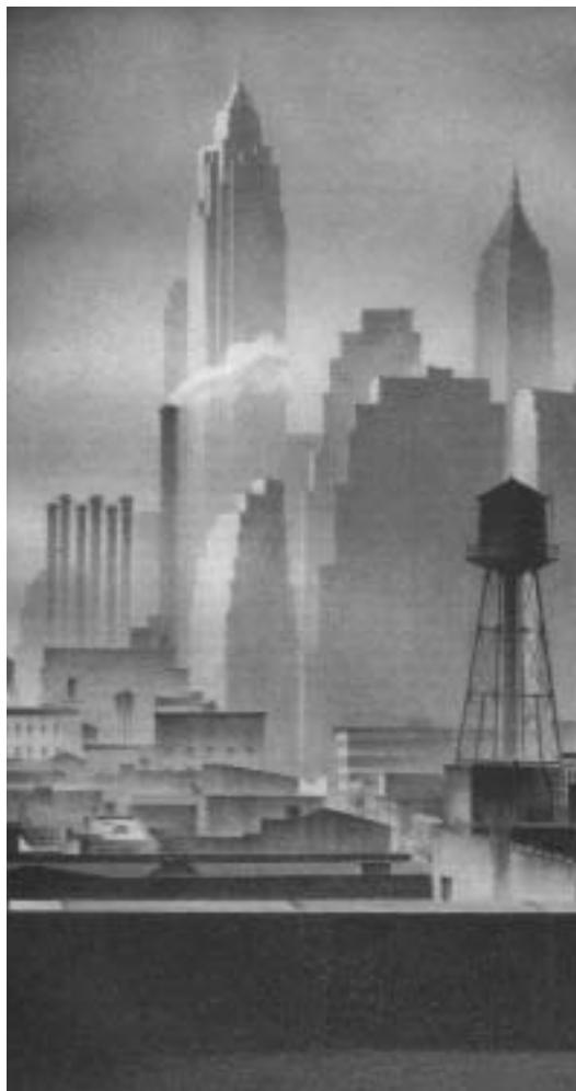
Shadows of downtown, 1933. O. Jevosky.